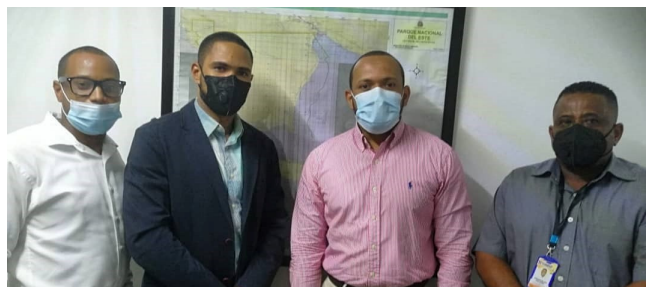
Reunión con Dir. medio Ambiente

EL DEPARTAMENTO DE PLANEAMIENTO URBANO DE LA MANO DEL ALCALDE MUNICIPAL SIEMPRE CON LAS MEJORES PROPUESTAS Y EL MEJOR DESEO DE AYUDAR.