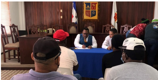
Reunión con Motoconchistas