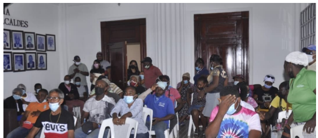
Reunión con vendedores Informales