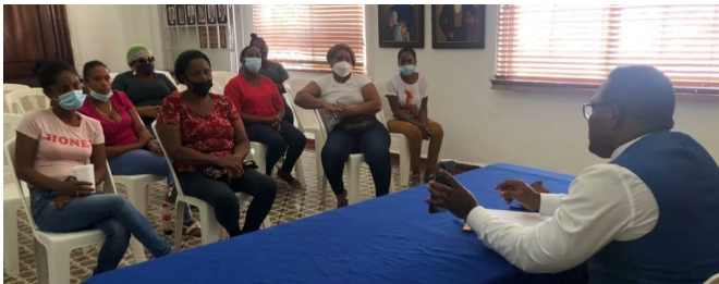
Reunión con vendedores de frutas