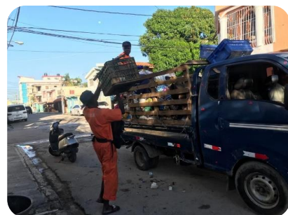
RECOGIDA DE BASURA EN VILLA ESPAÑA CALLE C