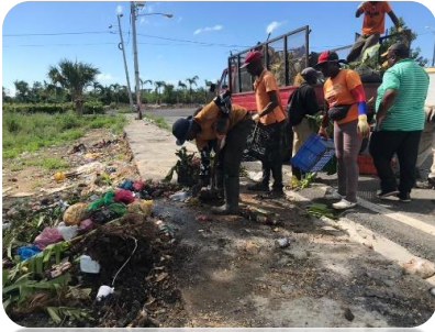
OPERATIVO DE LIMPIEZA EN LA AV. CAAMAÑO CON LA RUTA DE QUISQUELLA.