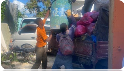
RECOGIDA DE BASURA EN LA CALLE INDEPENDENCIA.