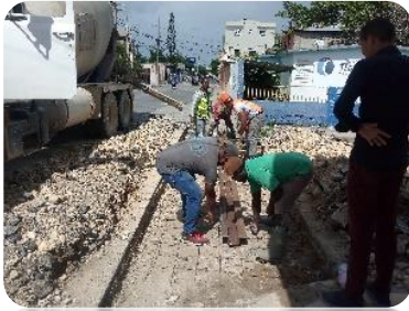
CONSTRUCCIÓN DE BADEN DE QUISQUELLA.