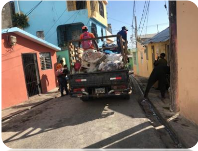
RECOGIDA DE BASURA EN LA CALLE CAMBRONAL.