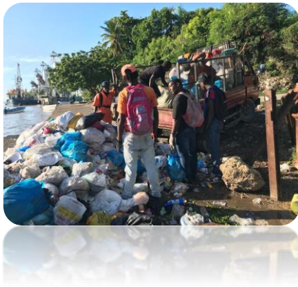
RECOGIDA DE BASURA EN EL MUELLE LOCAL.