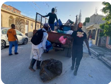
RECOGIDA DE BASURA EN VILLA ESPAÑA CALLE B.