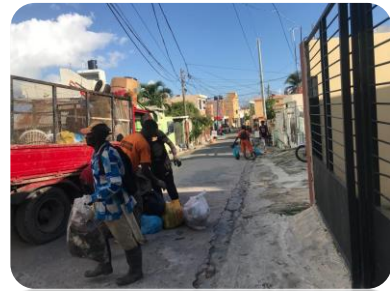
RECOGIDA DE BASURA EN LA CALLE JUANA SALTITOPA.