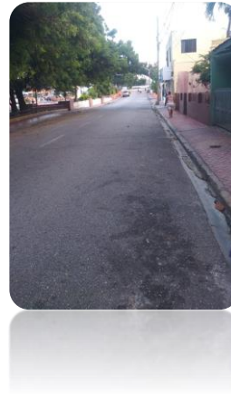
OPERATIVO DE LIMPIEZA EN EL SEMÁFORO DE LA CAAMAÑO DEÑÓ CON PADRE ABREU.