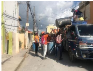
RECOGIDA DE BASURA EN EL ENSANCHES LA HOZ.