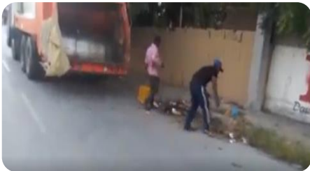
RECOGIDA DE BASURA EN LA CARRETERA VIEJA.