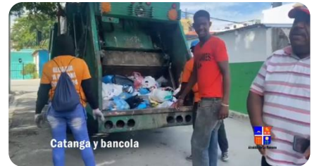
Catanga y bancola