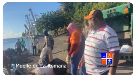
Muelle de La Romana