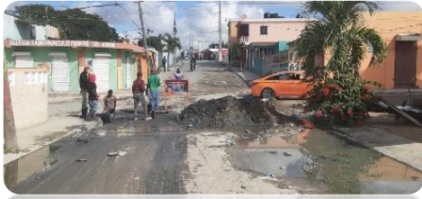
LIMPIEZA DE IMBORNAL EN LA CALLE A DE VILLA SAN CARLOS.