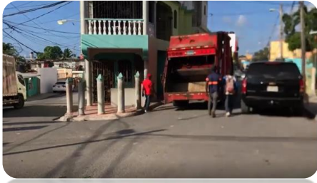
RECOGIDA DE BASURA CALLE D DE SAN CARLOS.