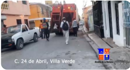
C. 24 de Abril, Villa Verde