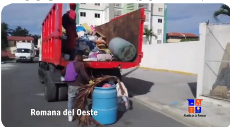
Romana del Oeste