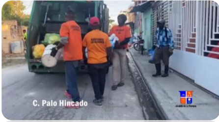
RECOGIDA DE BASURA EN LA CALLE PALO HINCADO.