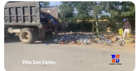
Villa San Carlos