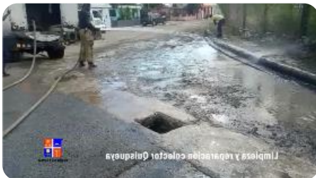
Limpieza y reparación colector Quisqueya

La Romana.- el Colector Pluvial ubicado en la ruta calle Amor y Paz del sector de Quisqueya, recibió su acostumbrada limpieza para evitar la acumulación de agua cuando llueve. Así mismo se utilizó para lavar la calle completa y el lodo acumulado en dicho lugar, los camiones del Cuerpo de Bomberos y una Pala Mecánica para retirar los escombros que lo rodeaban. Por disposición del Ejecutivo Municipal Lic. Tony Adames, se midieron las parrillas que hacían falta, para evitar la ocurrencia de los accidentes de tránsito y mucho más el plástico que llega hasta el lugar arrastrado por las lluvias, con esto evitar que los filtrantes colapsen.