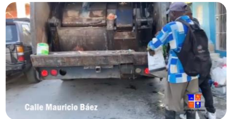
Calle Mauricio Báez