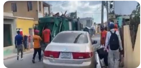
RECOGIDA DE BASURA EN LA BERMUDEZ.