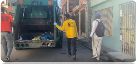
RECOGIDA DE BASURA EN LA CALLE LUPERÓN DE VILLA VERDE.