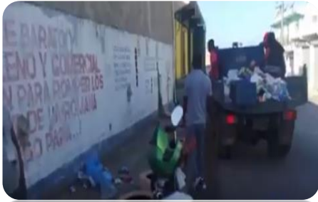
RECOGIDA DE BASURA EN EL BARRIO GEORGE.