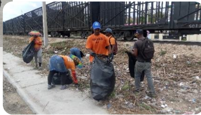
RECOGIDA DE BASURA EN EL VERTEDERO DE LA CALLE JUAN BAUTISTA MOREL.