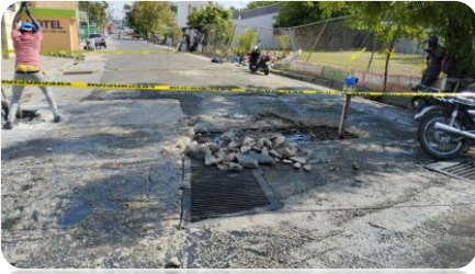
REPARACIÓN DE LOZA CALLE HÉCTOR P. QUEZADA ESQUINA DR. HERNÁNDEZ.