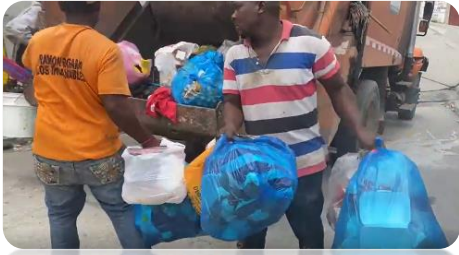
RECOGIDA DE BASURA EN EL SECTOR DE KATANGA.