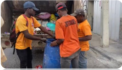
RECOGIDA DE BASURA EN EL SECTOR DEL ENSANCHE ALMEIDA.