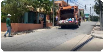
RECOGIDA DE BASURA EN EL SECTOR DE PRECONCA.