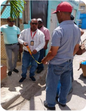
OPERATIVO DE COLINDANCIA CENTRO DE LA CIUDAD Y VILLA VERDE.