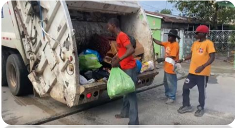
RECOGIDA DE BASURA EN LA BERMÚDEZ.