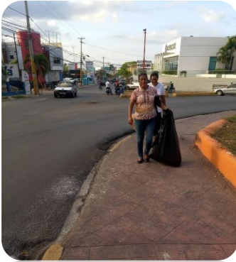
OPERATIVO DE LIMPIEZA PARQUE DE LA ROTONDA.