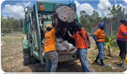
RECOGIDA DE BASURA EN LA 6TA BRIGADA DEL EJÉRCITO.