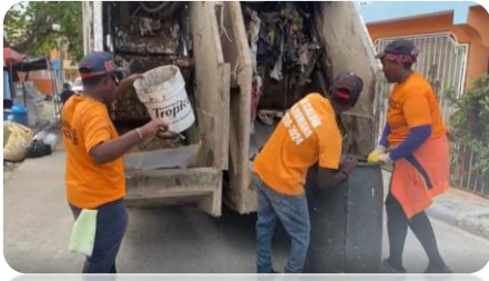
RECOGIDA DE BASURA EN LA CALLE PEDRO A LLUBERES, VILLA VERDE.