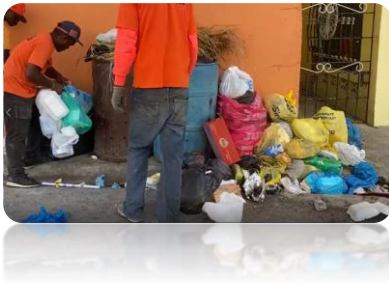
RECOGIDA DE BASURA EN LA CALLE MARÍA TRINIDAD SÁNCHEZ, VILLA VERDE.