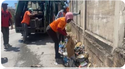
RECOGIDA DE BASURA EN LA SAGRARIO DÍAZ.