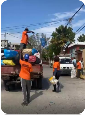
RECOGIDA DE BASURA EN LA BERMÚDEZ.