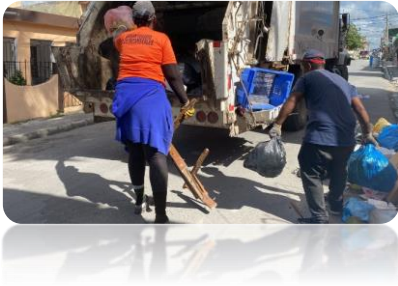
RECOGIDA DE BASURA EN LA CONCEPCIÓN BONA, VILLA VERDE.