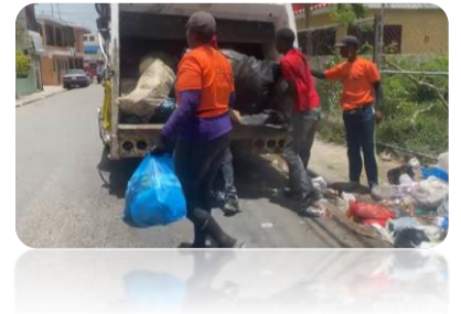
RETIRO DE ESCOMBROS EN LAS ACERAS DEL CUARTEL DE LA POLICÍA NACIONAL.