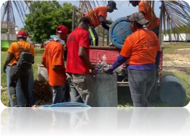
RECOGIDA DE BASURA EN EL HOGAR CREA.