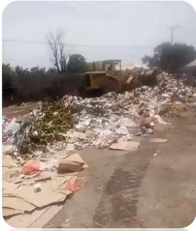
LIMPIEZA EN EL MERCADO MUNICIPAL.