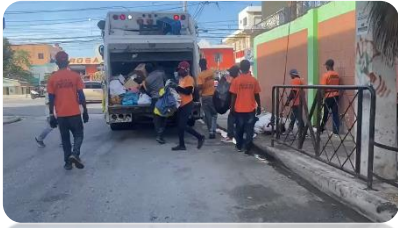
RECOGIDA DE BASURA EN LA BERMÚDEZ.