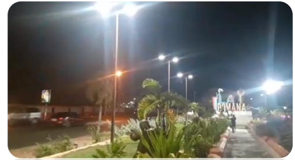
REPARACIÓN DE ILUMINACIÓN EN EL LETRERO A LA ROMANA.